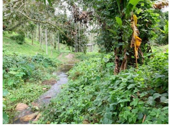
บริเวณที่จะดำเนินการก่อสร้างอาคารอัดน้ำ ๒ ช่องสี่เหลี่ยม ขนาด ๒.๐๐ x ๒.๐๐ เมตร ความยาว ๔๑.๒๐ เมตร