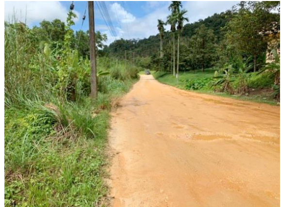
บริเวณเส้นทางที่จะติดตั้งระบบท่อส่งน้ำและอาคารประกอบ ความยาว ๓,๐๖๓ เมตร พร้อมก่อสร้างอาคารบ่อกักน้ำ รวมจำนวน ๕ แห่ง