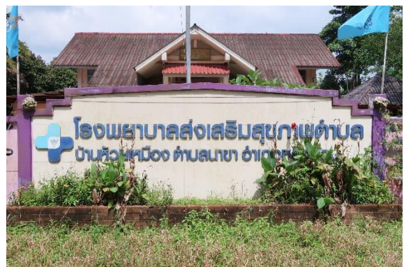
ครูและนักเรียนของโรงเรียนตำรวจตระเวนชายแดนบ้านห้วยเหมือง รวมถึงโรงพยาบาลส่งเสริมสุขภาพตำบลบ้านห้วยเหมือง และราษฎรในพื้นที่โดยรอบ ที่จะได้รับประโยชน์จากโครงการฯ